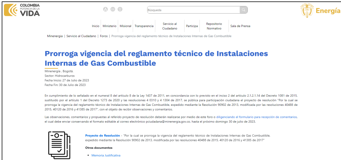
Ilustración 1 Divulgación: publicación en el espacio foros/ Portal Web MinEnergía

Prorroga vigencia del reglamento técnico de Instalaciones Internas de Gas Combustible (minenergia.gov.co)