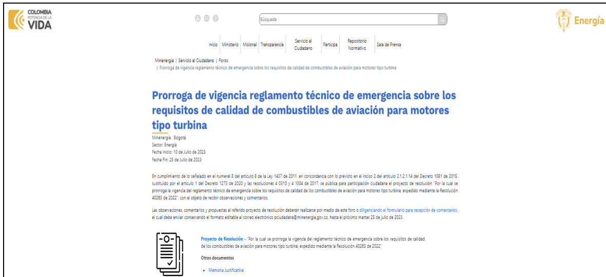
Ilustración 1 Divulgación: publicación en el espacio foros/ Portal Web MinEnergía

Prorroga de vigencia reglamento técnico de emergencia sobre los requisitos de calidad de combustibles de aviación para motores tipo turbina (minenergia.gov.co)