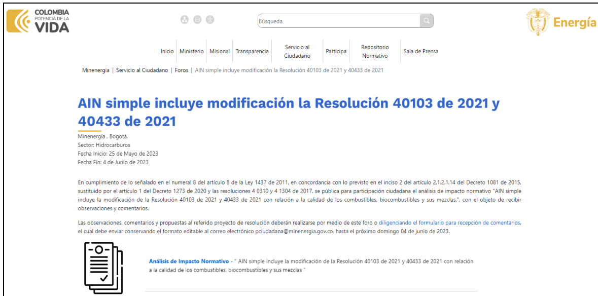
Ilustración 1 Divulgación: publicación en el espacio foros/ Portal Web MinEnergía

AIN simple incluye modificación la Resolución 40103 de 2021 y 40433 de 2021 (minenergia.gov.co)