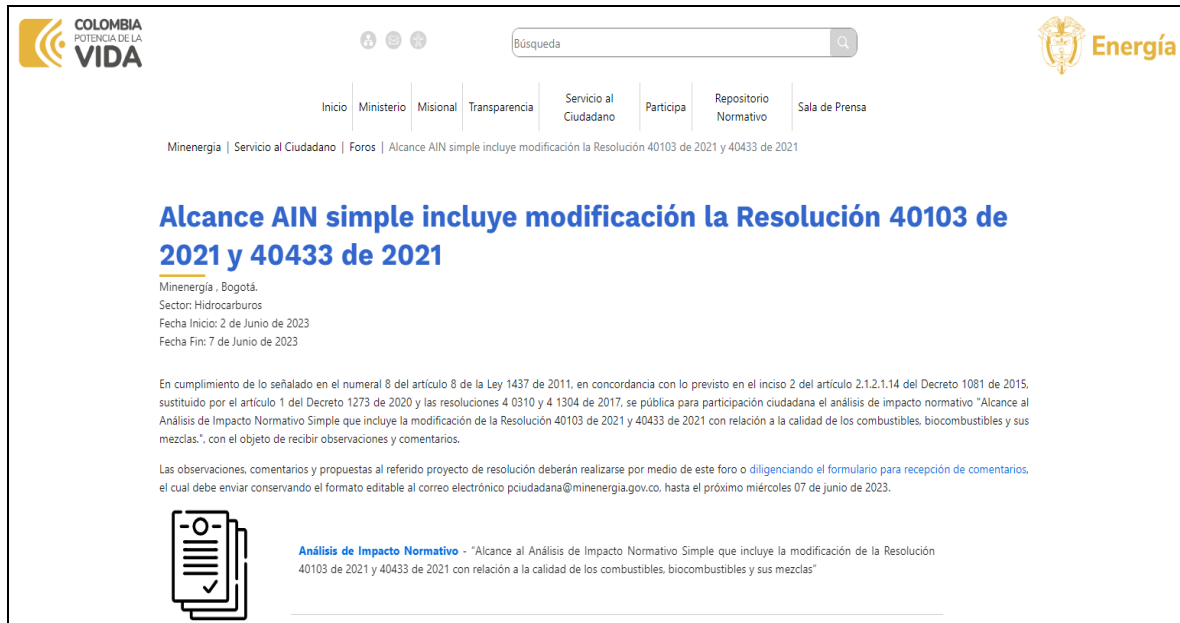
Ilustración 1 Divulgación: publicación en el espacio foros/ Portal Web MinEnergía

Alcance AIN simple incluye modificación la Resolución 40103 de 2021 y 40433 de 2021 (minenergia.gov.co)