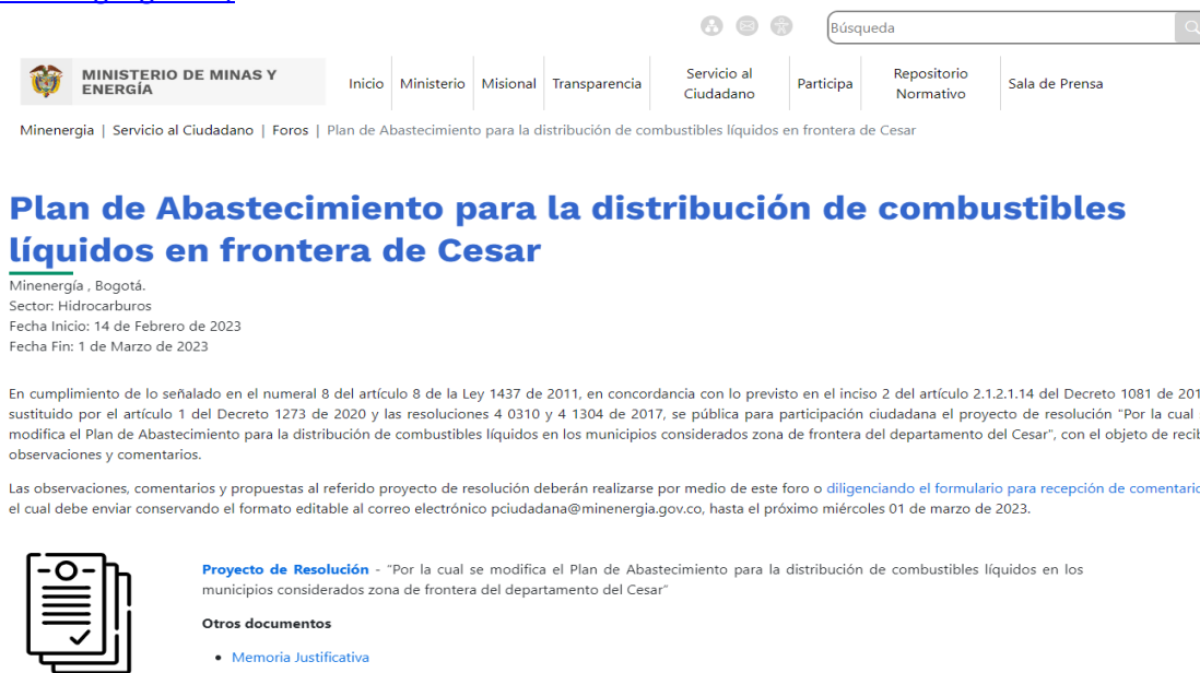
Ilustración 1 Divulgación: publicación en el espacio foros/ Portal Web MinEnergía

Plan de Abastecimiento para la distribución de combustibles líquidos en frontera de Cesar (minenergia.gov.co)