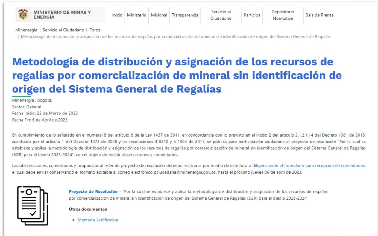
Ilustración 1 Divulgación: publicación en el espacio foros/ Portal Web MinEnergía

Metodología de distribución y asignación de los recursos de regalías por comercialización de mineral sin identificación de origen del Sistema General de Regalías (minenergia.gov.co)