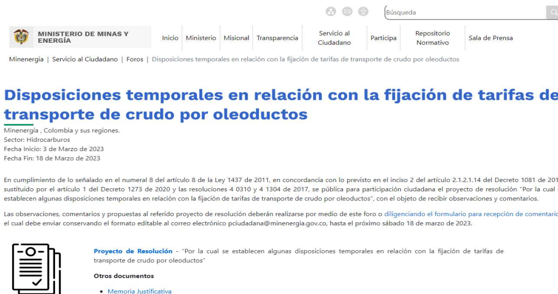
Ilustración 1 Divulgación: publicación en el espacio foros/ Portal Web MinEnergía

Disposiciones temporales en relación con la fijación de tarifas de transporte de crudo por oleoductos (minenergia.gov.co)