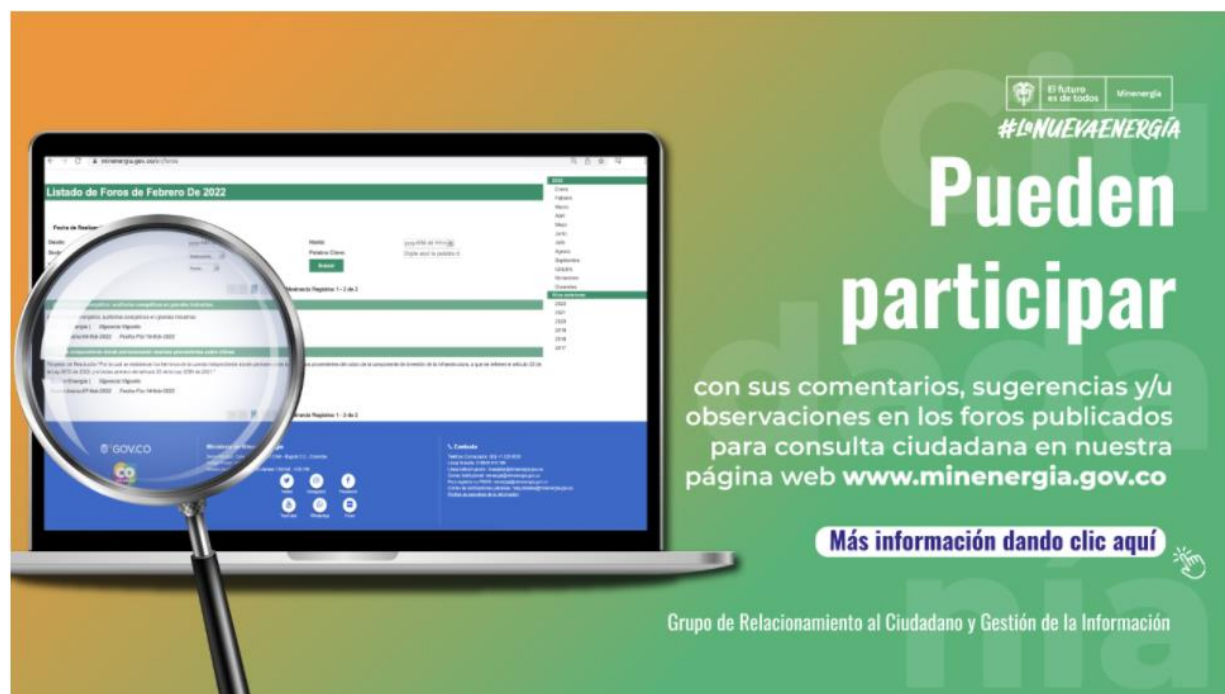
Ilustración 3 Divulgación: Mensaje a correo electrónico de ciudadanía y partes interesadas.