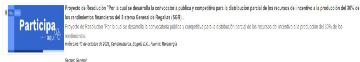
Ilustración 2 Divulgación: publicación en el espacio foros/ Portal Web MinEnergía

Ilustración 1 Divulgación: publicación en el espacio foros/ Portal Web MinEnergía