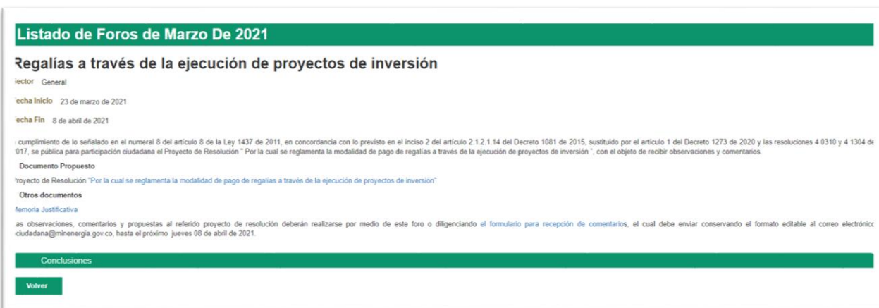
Ilustración 1 Divulgación: publicación en el espacio foros/ Portal Web MinEnergía

https://www.minenergia.gov.co/en/foros?idForo=24279279&idLbl=Listado+de+Foros+de+Marzo+De+2021