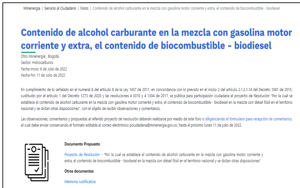
Ilustración 1 Divulgación: publicación en el espacio foros/ Portal Web MinEnergía

https://www.minenergia.gov.co/es/servicio-al-ciudadano/foros/contenido-de-alcohol-carburante-en-la-mezcla-con-gasolina-motor-corriente-y-extra-el-contenido-de-biocombustible-biodiesel/