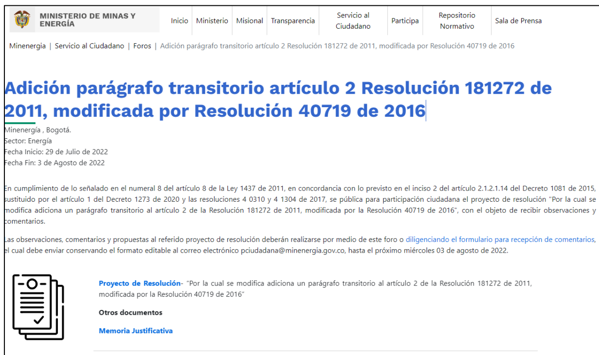
Ilustración 1 Divulgación: publicación en el espacio foros/ Portal Web MinEnergía

https://www.minenergia.gov.co/es/servicio-al-ciudadano/foros/adici%C3%B3n-par%C3%A1grafo-transitorio-art%C3%ADculo-2-resoluci%C3%B3n-181272-de-2011-modificada-por-resoluci%C3%B3n-40719-de-2016/